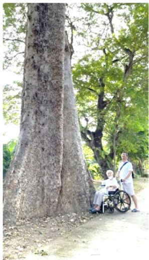
木には望みがある。(聖書) 洪水に負けなかった 木に励まされつつ。