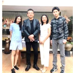
主のご降誕を喜び、 皆様の幸せとご健康をお祈りいたします。